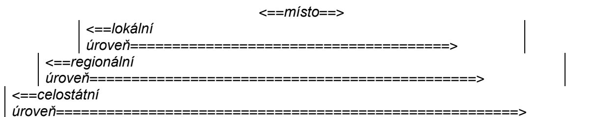
obrázek 1 Hlavní aktéři mimořádné události výbuchu v muničním skladu ve Vrbětících a jejich rozmístění v arénách